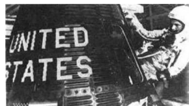
Я надеваю свой плащ и волшебную шляпу