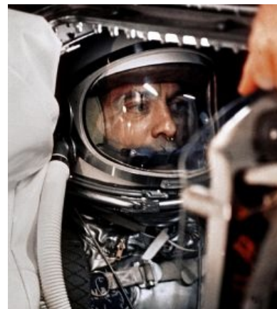
Алан Шепард в скафандре, в капсуле, в вакууме, в ахуе

В 1959 году среди соколов Пенсаколы NASA отобрало лучших из лучших и начало их дрессировать. К весне 1961 года всё было готово, чтобы стрелять людьми в космос. Первым, 5 мая 1961 года, через две недели после Гагарина полетел Алан Шепард. Капсула его называлась весьма странно: Mercury-Redstone 3 , а кроме официального названия имела и другое погоняло — Freedom 7 . Более того, никнеймы кораблей в последующих полётах менялись, а вот цифра семь оставалась неизменно. В официальном номере тройка объясняется просто — американцы нумеровали полёты капсул, а не пилотов. Перед Шепардом успели запустить удачно одну обитаемую капсулу и одну с обезьянкой. А второе имя кораблю придумал сам Шепард, цифра же обозначала не порядковый