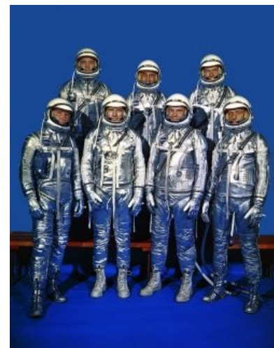
Великолепная семёрка. Имею скафандр, готов путешествовать

Судьбы первых астронавтов оказались различными: