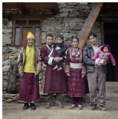
Тибетская семья: отец семейства, старший муж, жена, младший муж и дети. Больше фоток