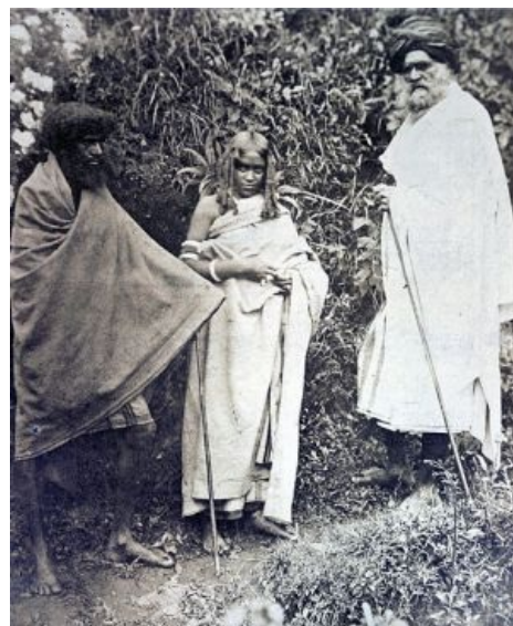
Индийская полиандрия. 1871 год.

ИЧСХ, процедура обращения с просьбой к президенту о заключении такого брака осталась. То есть,