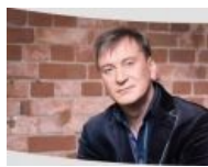
Добкин? А вот хуй, Пенкин.