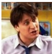
Добкин? А вот хуй, Гена Букин.