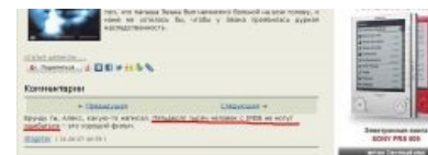
Комментарий к неместной рецензии Экслера на фильм «Эффект бабочки»