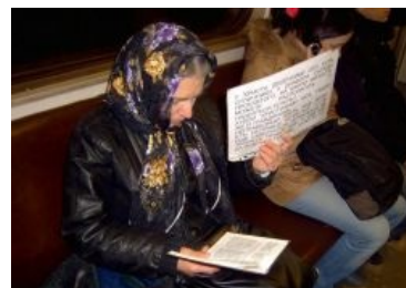
Лютая православная метробабка