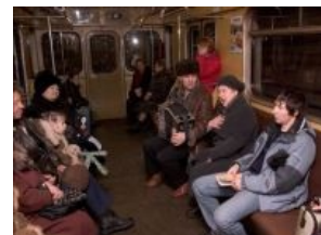
Громкая метробабка с мобильным гармонистом.