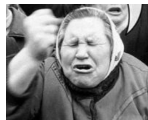
«Бох нака-ажэт, нака-ажэт!» Алсо налицо сходство с Вангой .