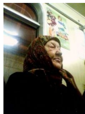
Warning: Ельцин метробабка не прощает.