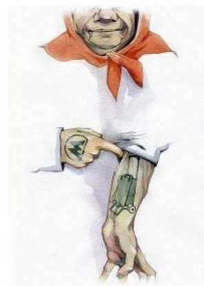
Метро-прайд, из банды зеленой линии.