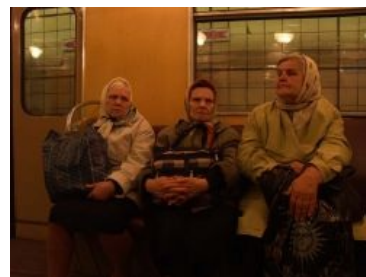
Типичные метробабки, засняты на станции «Кузьминки»