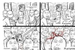
У б-га тоже есть чувство йумара — к вопросу о библейских «гробах прихоти»