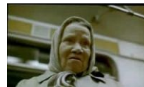
Метробабка смотрит на тебя как на обязанного уступить место.