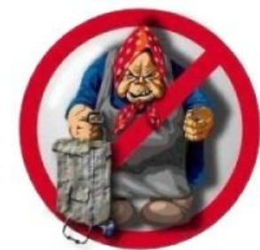
Знак «Метробабкам вход воспрещён»!