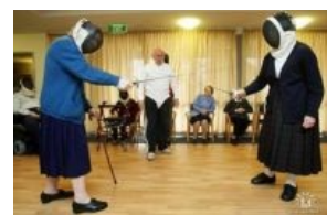
Горцы: в живых остаться должна только одна

Бабка с прицепом (лат. Babkus tractorus ) Бабка с прицепом в естественной среде обитания