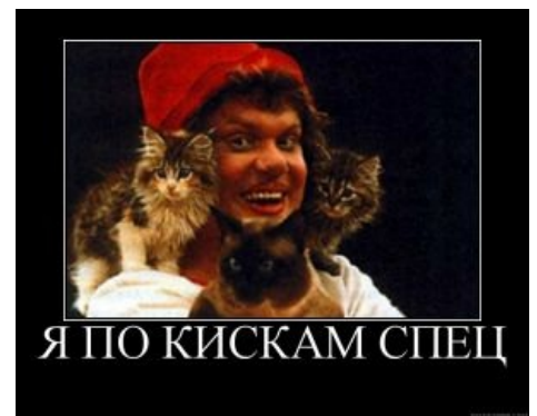
По кискам спец.