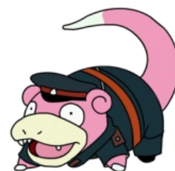
Новоментач такой Новоментач.

Новоментач ( Ментиреч, Нольдватиреч ) — продолжатель традиций Тиреча в отношении доменного имени. По мнению одних — никому на хуй сдавшаяся борда, по мнению других — уютный небольшой АИБ с адекватными анонами. Показал себя устойчивым, когда злосчастный Тиреч падал каждый час, а Ычан и вовсе был в выпиле. Был скорее резервным убежищем на всякий случай, чем полноценной бордой. Местный Зой был адекватен по отношению к беженцам с разуплотненных временно борд. Борда была винрарна тем, что содержала такие доски как /int/, /404/, /fug/, /url/, была красиво оформлена и пригодна для жизни. Около 19 октября 2009 года техраздел /02/ был перемещен в /d/, а вместо /d/ запилен /dg/. Примечательно это событие исключительно тем, что сразу после этого работа тематических досок была парализована — все доски, кроме /d/, /dg/ и /404/, показывали вместо себя /b/. 4 ноября 2009 года хостинг Новоментача перестал предоставлять услуги хостинга новоментачу. Это конец новоментача . По состоянию на 15 июня 2010 года по домену доступна хуита, рекламирующая недоCMS, на 28 октября 2010 года — предлагают купить недвижимость в Башкортостане, лол.