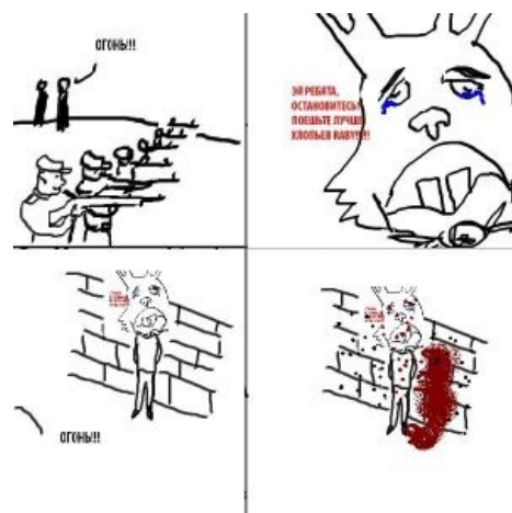
Комикс с кроликом Раби.

«Ментач, я твой новый мем» как реакция на разговоры вроде «несколько месяцев борде, а мемов-то нема» и на форс УГ, выдаваемого за эти самые мемы. В ходе репостинга «контента» на Тирече вспомнили некоторые детали биографии сабжа. В частности, когда Кирилыч выпивает портвейна, он становится непобедимым и творит чудеса. Он охраняет Марс, борется с раком, ненавидит школоту. Пикрелейтед — самая первая пикча Кирилыча.