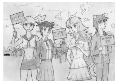
Мир, Труд, Май, Доброчан же

Неверно многими чанерами воспринимается как доброчановский художник, но это не так, несмотря на то, что официальные мангака-треды прочно поселились в /b/, а затем в /сг/ Доброчана, и Мангакой были созданы тонны доброчановского контента. На Доброчане был возведен в ранг полубога, но после пришествия новой ормтэшной администрации переругался с мод-кунами, за что бывал неоднократно бит банхаммером (и на момент написания статьи также находится в бане, что официальная администрация доброчана опровергает, ссылаясь на неведомые технические неполадки), да и былую популярность потерял в связи с переездом на Доброчан множества других художников, не уступающих ему в качестве воробья . Доставшееся чану от Мангаки и Менеджер-куна наследие — визуально оформленная страница 404. И сотни арта на тему доброчановских маскотов и мемов.