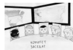
Комитет заседает — Новей выпиливат