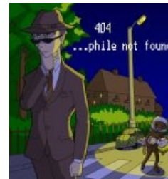
ФСБ-кун и педобир...

Был замечен повышенный интерес Мангаки к педобирам и центральным процессорам (енкомы, отдельные пикчи, раскрывающие суть ФСБ-кунов, длительная арка с технопедобиром), что как-бы намекает. Одна из главных особенностей его творчества — всепоглощающая любовь к майндфакам, которых он пихает по десятку штук на каждую страницу. До сих пор лишь малая их часть найдена. Приготовьтесь срать кирпичами. Мангака неоднократно был замечен в различных фагготриях. Хоролуб, куклоб, евафаг, Вассал Лямбдадельты , юкехейтер.