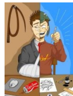
Кто же он?