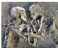
In dark embrace.

Любовь исторически считается достаточным поводом и оправданием (примерно как «ну я же был выпивши!») для самых мудацких действий. Несмотря на многочисленный и весьма печальный опыт человечества, гуммунаррии и прочие пейсатели ухитрились создать в фимозгах 95% населения устойчивую картину «любовь это щасте! Всё фигня, только любовь рулит!». Их можно понять, о чём ещё писать при отсутствии как у автора, так и у ЦА моска? Популярное искусство крутится на теме любви, непопулярное выкручивается противостоянием системе или наркотиками, что столь же уныло.