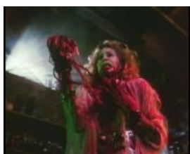
Возьми моё сердце!