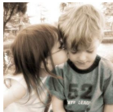
Всё начинается с поцелуя...

«Послушай, Морти, не хочу тебя расстраивать, но то, что люди называют любовью, — это просто химическая реакция, вынуждающая животных размножаться. Поначалу это сильное чувство, Морти, но потом оно медленно слабеет, оставляя тебя в неудавшемся браке без копейки в кармане. Так было у меня, так будет у твоих родителей. Разорви порочный круг, Морти! Будь выше этого! Займись наукой! »