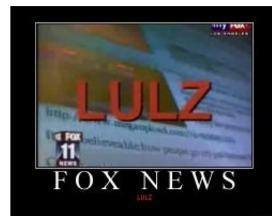
Лулз на американском телеканале FOX LA

Последствия злоупотребления поклонением сабжу: