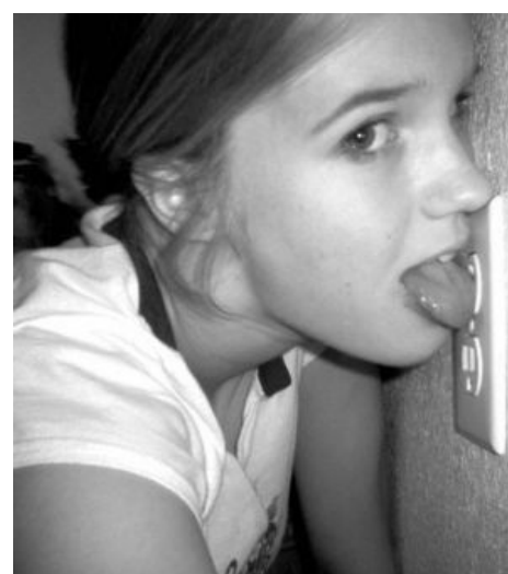
Оно самое, в действии.