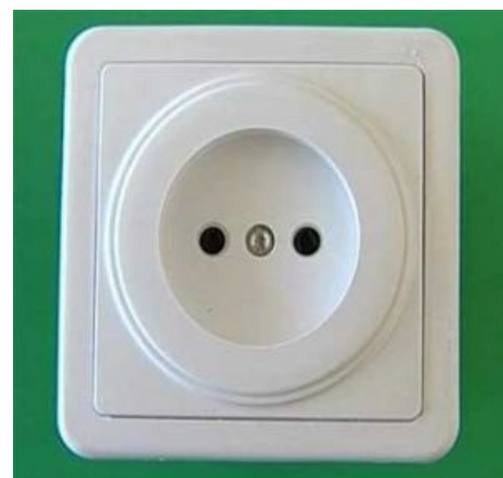
Объект для лизания.