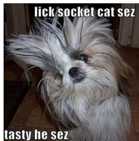
Кот сказал лизнуть розетку! «Вкусно», сказал он.