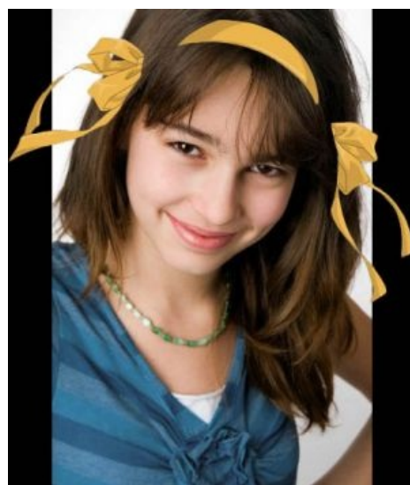
Багиня была совсем рядом.

В итоге Анонимус обнаружил аккаунт свежепредставившейся лолиты Вконтакте и сумел выйти на группу её бывших одноклассников. Но, так как Анонимус уже не торт , школьники анально огородились и не дали не