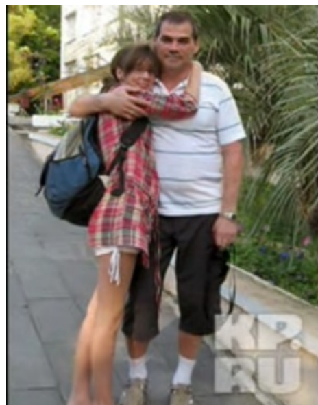
Лида со своим отцом