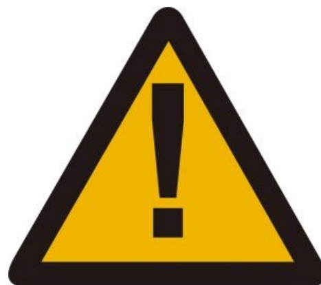
Середина октября 2013. А город подумал — «ученья идут» (спойлер: Rarjpeg )