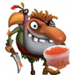
...с костями и без соли

Когда пират становится пейратом — это пиздец .