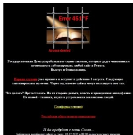
Флибуста, начало июля 2013