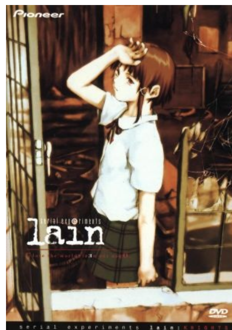
Serial Experiments Lain