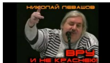
Посылает нахуй неверных