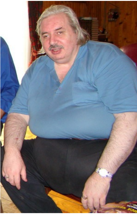
Такое тело должно быть у каждого ниндоеа -сверхчеловека

Поциент считал, что смело вышел за рамки устоявшихся научных и социально-политических парадигм, тормозящих и ставящих под угрозу само развитие человечества и его существование. Издал и распространил множество псевдонаучных книг на основе «нью-эйджа» и абстрактной духовности, периодически пускаясь в денежный чёс на встречи с читателями. Свой вклад в долбославие привнёс книгой «Россия в кривых зеркалах» (2007 г.) в двух частях, в которой изложил свой взгляд на законы развития человеческого общества и земной цивилизации (читать не рекомендуется). Большую часть своих утверждений, связанных с историей славян, Левашов почерпнул из труда Ахиневича «Славяно-Арийские Веды», утверждая при этом, что никакого Хиневича он не знает, а читал сами «первоисточники», и что у него даже есть какое-то «посвящение». В 2010 году писанина признана экстремистским материалом, ЧСХ .