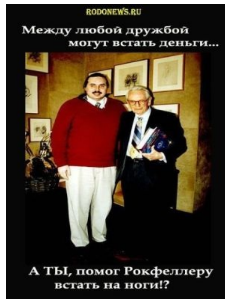
Пациент и Рокфеллер