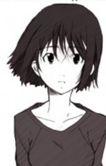
Мисаки не придёт

Ты такой милый... У тебя нет машины? Ну и что? Не приятней прогулки с тобой. Твоя мама замечательный человек, неудивительно, что ты до сих пор живёшь. Спасибо, но мне не надо кафе и ресторан. Ты знаешь, я и сама хорошо готовлю, получше, чем во многих этих ресторанах. Приходи ко мне в гости и попробуй. Ты тот, кого я ждала всю свою жизнь. Ведь кроме тебя у меня никого и никогда не было