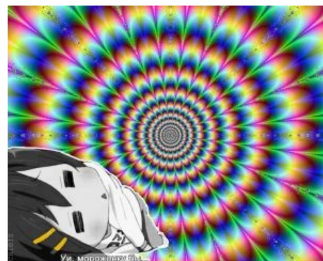
ЛСД — АЙС...

[POV] Trip Pt.1 Действие ЛСД Опыты по воздействию ЛСД, 1950-е годы. Опыты по воздействию ЛСД, 1950-е годы.