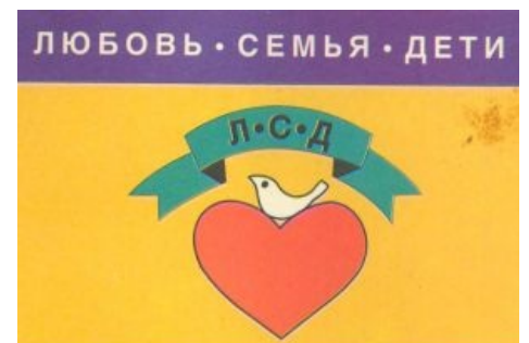
Любовь, семья, дети