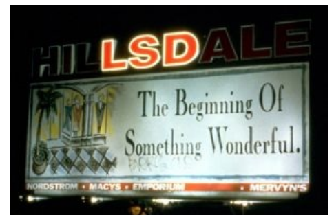
The Beginning of Something Wonderful

Доподлинно неизвестно, кому молился Хофманн, но доза, по его записям, составила не менее 250 мкг. Наверное, он бы принял и больше, но справедливо побоялся завернуть ласты, и поехал домой на велосипеде. Выбор транспортного средства был вызван ограничениями военного времени. Тем не менее, сему первооткрывателю посчастливилось добраться домой почти без приключений [2] и пережить забавный, первый в мировой практике, ЛСД-трип, а заодно и первый кислотный бэд, в котором он рассуждал о насущном и вечном: