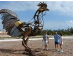
Суровый железный кур из Ки Уэст, Флорида