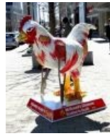
Креатив от зоозащитников: не всем курам весело умирать ради твоего «МакЧикена»