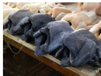
Политкорректный вариант курятины.