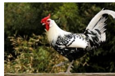
Петух гамбургский IRL. Нет, ну правда гамбургский

Некоторые заявляют, что курица — не птица , но несмотря на это утверждение, куры одни из самых успешных птиц за историю эволюции . Да, летают они недалеко и только с пинка, но этот невеликий недостаток куры с лихвой компенсируют высокой репродуктивностью, неприхотливостью к жратве и условиям обитания, а главное — они пришлись по вкусу человеку.