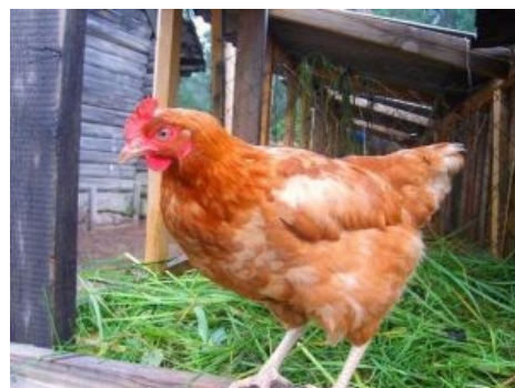
Что у нас сегодня на ужин?

«Хоть и говорят, что курица не птица, но многоборская курица именно что птица — поджарая, закаленная, отчаянная. Прошлым летом, например, забрался ночью в княжеский курятник вор, так они его чуть не до смерти заклевали... »