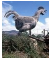
Гигантский бетонный кур в одной вьетнамской деревне, 1975