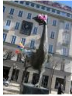
Памятник вечно спешащей деловой женщине напротив стокгольмского супермаркета — курица в шляпке