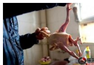
Четвероногая курица из Хеврона. Смаживает на Alkari из первого Master of Orion