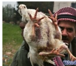
Пока евреи спорили, китайцы поступили намного проще.

Четвероногая курица из Хеврона. Смаживает на Alkari из первого Master of Orion