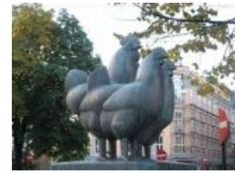
Обосранный голубями памятник курам в Осло