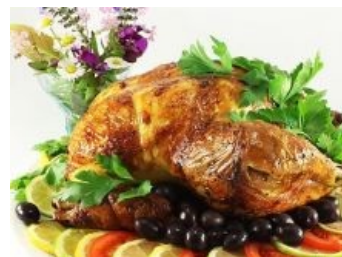
Логичный конец большинства кур.

Новозеландские фермеры же в аналогичной ситуации поступили более прагматично. Четырёхногий куртавр содержится в неге и ласке, как возможный обладатель редкого, но совместимого с сородичами гена. Что, в принципе, чревато скорым появлением породы кур с удвоенным количеством окорочков на тушку, причём без всякого ГМО . Ну, без плазмидного ГМО точно. КФС потирает руки в предвкушении (грудки на фаст-фуд как-то не очень идут, а вот крылья и особенно ноги составляют основную статью дохода). Сам тыгдымский кур, правда, пока развивается как-то невнятно.