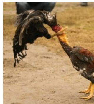
Суровое мочилово петухов бойцовых пород.