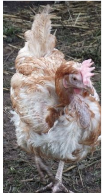
Ветеран яичного фронта — курица «ломанн-браун».