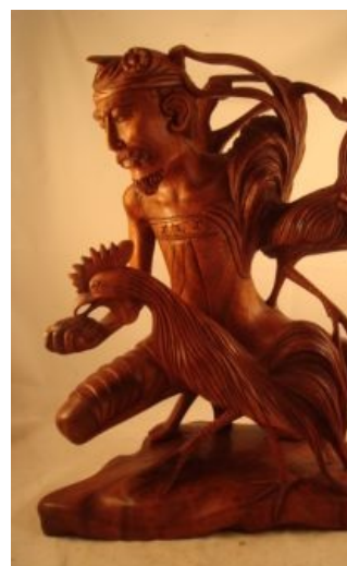
Желающие могут поискать эротический