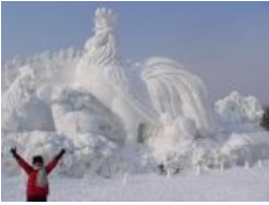
Креатив из снега. Заслужили