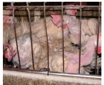
Куриный Бухенвальд. Обратите внимание на клювы птиц: кончики подрезаны.

Ветеран яичного фронта — курица «ломанн-браун».