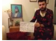
И умудряются против сексизма выступать