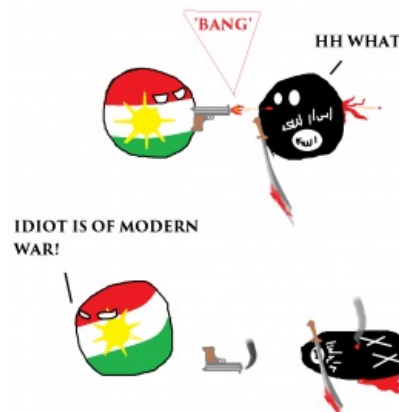
Kurdistanball и ISISball