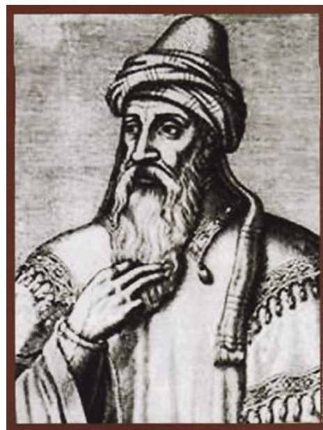
Салах Ад-Дин смотрит на тебя, как на крестоносца

Поняв, что в результате последних событий им уже почти ничего не светит, крестоносцы решили захватить Константинополь ещё раз, но уже «по-настоящему». В пятницу 13-го апреля 1204 г. город, который 100 лет назад призвал к крестовым походам, был взят и разграблен силами, которые когда-то были призваны его защищать. В результате вышеуказанного анального цирка Византия перестала