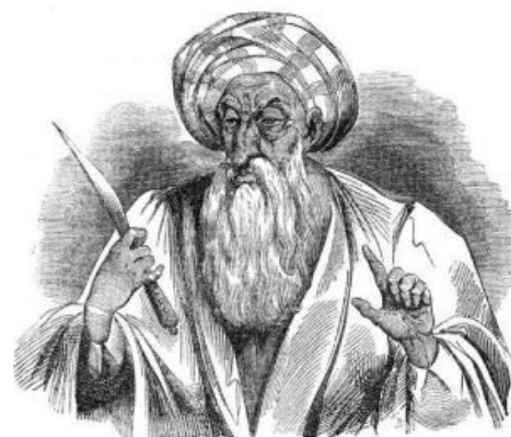
Главный укурек Хасан ибн Саббах

Началось всё с упорыша по имени Хасан ибн Саббах, который сам будучи немного поехавшим на аскетизме, запилил такое же мини-государство с бессмысленно суровым образом жизни для всех без исключения. Убив с помощью небольшого отряда фанатиков-хашшашингов главного визиря государства Сельджукидов [3] , Ибн Саббах пришёл к очень простому, но, тем не менее, гениальному выводу: можно выстроить весьма эффективную оборонительную доктрину государства и, в частности, движения исмаилитов-низаритов, не затрачивая значительные материальные средства на содержание большой регулярной армии. Необходимо было создать свою «спецслужбу», в задачи которой входило бы устрашение и показательное выпиливание тех, от кого зависело принятие важных политических решений; спецслужбу, которой ни высокие стены дворцов и замков, ни огромная армия, ни преданные телохранители не могли бы ничего противопоставить, чтобы защитить потенциальную жертву. Хасан ибн Саббах умер в 1124 году, после себя он оставил радикальную религиозную идеологию и тесно сплетенную сеть хорошо укрепленных горных крепостей, управляемых его фанатами — такими же упорышами как и он сам. Государству Ибн Саббаха было суждено просуществовать ни много ни мало ещё 132 года.