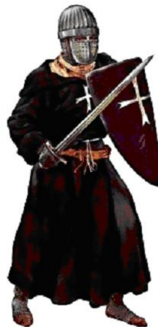
Сферический «Госпитальер» в вакууме

Ordo Militaris et Hospitalis Sancti Lazari Hierosolymitani — члены ордена Госпитальеров, выделившиеся при Раймоне де Пюи в Орден Святого Лазаря с зелёным мальтийским крестом, во главе которого стал главврач Буайян Роже. Как можно догадаться, Орден специализировался на уходе за тяжелобольными и постройке лазаретов. Тем не менее, имел не только врачей, но и рыцарей, видом напоминавших армию... Нургла! Изрядная часть воинов Ордена походила своим видом на ходячие гниющие трупы, ибо субспециализацией Ордена был уход за больными лепрой , что выливалось в немалый % прокажённых среди рыцарей, которые часто для устрашения шли в бой не в вёдрах, а в шлемах с открытым лицом, демонстрируя свои гниющие раны. Если случайный рыцарь или член любого другого Ордена заболел проказой, то практически единственным способом не стать изгоем для него было вступить в Орден Святого Лазаря, имевший в итоге в своих рядах рыцарей, которым нечего терять, и потому стоявших насмерть, да ещё и почти не чувствовавших боли (из-за проказы же). Орден несколько раз уничтожался в полном составе во главе с магистром и вновь возрождался из уцелевших лазаретов и заболевших проказой рыцарей. Существует и по сей день. А небольшие военно-медицинские учреждения до сих пор называют «лазаретами» благодаря ему.