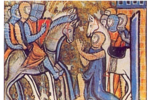
Захват Антиохии. Нотариально заверенный скриншот

Когда волна народной истерии несколько спала, в поход выступило дворянство и рыцарство. Вот кто вёл тот поход: от Англии — Роберт Нормандский — сын короля Вильгельма Завоевателя. От королевского домена Франции (Иль-де-Франс) — Стефан Блуа и Гуго Вермандуа, младший брат короля Филиппа I и, ВНЕЗАПНО, сын Анны Ярославны. Рыцарей Окситании возглавил Раймонд Тулузский, а норманнов Италии — Боэмунд Тарентский и его племянник Танкред . Северные районы Франции и Лотарингию представляло трио братьев Бульонских: Готфрид, Эсташ и Балдуин. Думаешь, эти имена ничего не значат? Автохуй: каждый из них стал кумиром не только для потомков, но и для пейсателей рыцарских романов. Всё рыцарство позднейших веков задрочивалось на своих героев, эти имена стали культовыми для многих поколений наперёд.