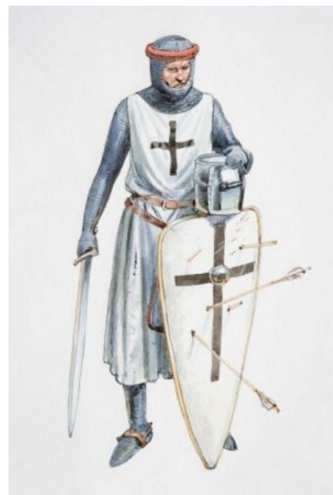
Тевтоны: одежда белая - крест черный

Молодой, динамично развивающийся орден тевтонских рыцарей в Прибалтике пользовался бешеной популярностью в немецких дворянских кругах, искавших, куда сплавить младших сыновей без наследства, так что в XIV веке из-за избытка кандидатов туда стали брать только благородных в 4 поколениях со справкой . Духовная составляющая братства от этого натурально скатилась в сраное говно: в XV в. в столице ордена Мариенбурге вполне легально действовал VIP-бордель для монахов-рыцарей, а незаконные детишки Великих магистров получали самые хлебные места. Логическим завершением такого беспредела стала секуляризация Ордена в 1525 г. — гроссмейстер Альбрехт фон Гогенцоллерн реорганизовал орден в герцогство Пруссию, став её первым герцогом, а заодно и перекрестил подданных из католицизма в лютеранство.