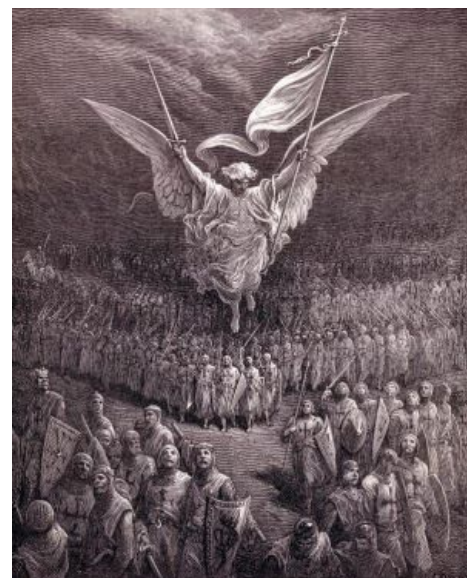
Ангел с гравюры Доре как бы говорит крестоносцам: « Наше дело правое, враг будет разбит, победа будет за нами! »

https://www.youtube.com/watch?v=ZTinm6Z1pe4