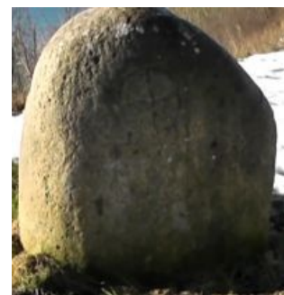
Символ солнца на