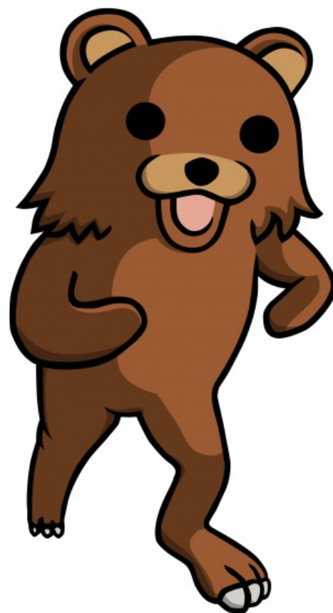
Суть похода одной картинкой

В 1147 Бернар Клервоский, собирая Второй крестовый поход, озаботился тем, чтобы направить немецких герцогов Альбрехта Медведя Бранденбургского и Генриха Льва Саксонского против славян Поморья (с пометкой «либо будут крещены, либо умрут»). Главным образом затем, чтобы отвлечь их от дерибана Империи, дав возможность кайзеру Конраду спокойно сходить в крузату к Эдессе. Князья основательно разорили земли ободритов, но в их крещении не преуспели. Через двадцать лет епископ w:Абсалон при помощи принца Датского Вальдемара разорил Рюген с его храмами Святовита. В конце концов самим вендским князьям это всё надоело, они попросились в Империю, быстренько крестили народ и благополучно правили им — в Поморье до XVII века, а в Мекленбурге аж до 1918 года.