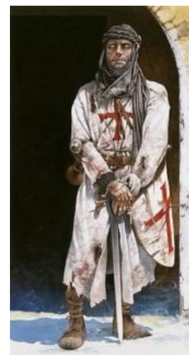
Обычный нищоброд тамплиер

После утраты Палестины госпитальеры поселились на Родосе, записались