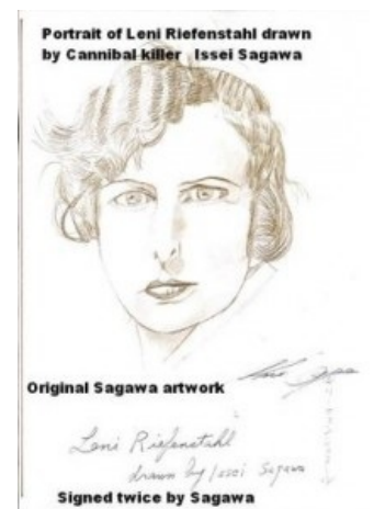
Портрет любимой женщины.