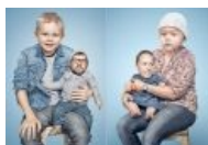
Родители и дети