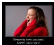
ТП-шка обезумела! Совладаешь ли ты с ней?