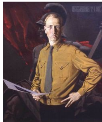
Холодный и суровый Васильев

«Еще на стенах были картины художника Константина Васильева. Эти картины, как я позже окончательно определил, — фирменная мультка всех сумасшедших, помешанных, как правило, при этом еще одновременно либо эпизодически на многом: русском язычестве, скандинавской мифологии, гитлеризме и всем, что связано с Третьим Рейхом, какой-нибудь славяно-горицкой борьбой. Иногда они еще для пущей комплекции увлекаются сатанизмом, готикой, зороастризмом, Толкиеном и раскопками могил времен Великой Отечественной. Любящие читать — читают Ницше и Адольфа Гитлера.»