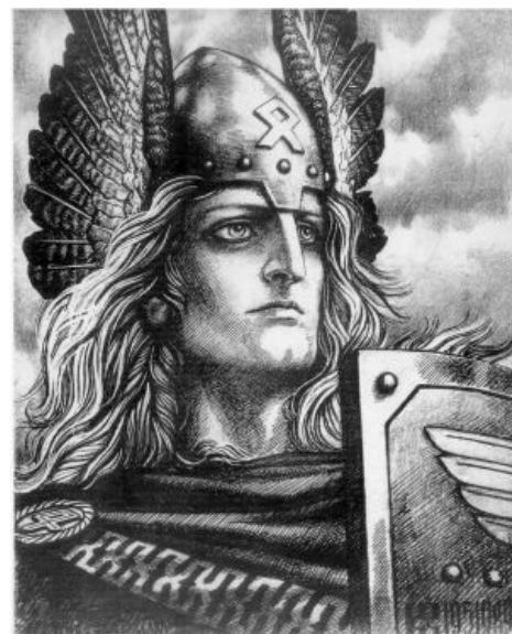
Нордично и героично