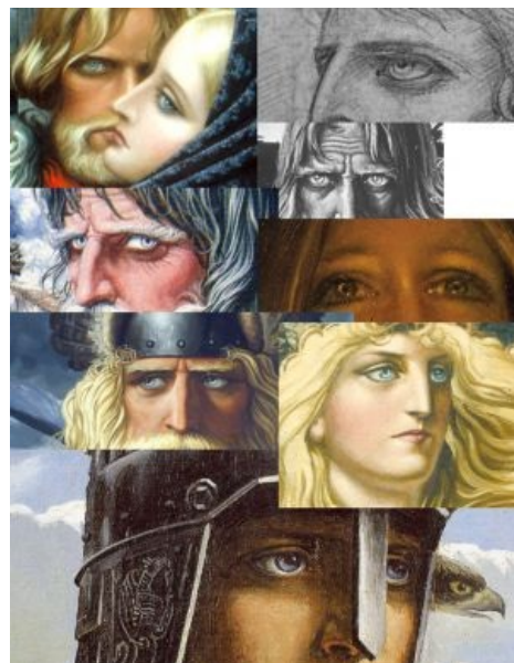
Ищите Суть в глазах

«Наследие Константина Васильева считаю Величайшим достоянием нашей Родины.