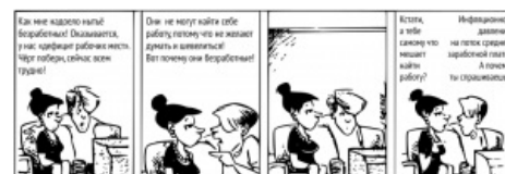
Кто бы спорил. (Комикс из учебника)

Ошибка с точки зрения статистики является неправильная выборка по принципу «В интернет-голосовании „Пользуетесь ли вы Интернетом?“ 100% опрошенных ответили утвердительно» и неправильные логические умозаключения, из неё следующие. Статистики нерелевантных выборок боятся как черт ладана, но обыватели легко попадают на эту и подобную ошибки. Собственно, из статистики она и стала известна широким массам. Во Вторую мировую войну венгерскому статистику Абрахаму Вальду дали задачу: проанализировать характер повреждений британских бомбардировщиков и дать советы по бронированию, учитывая, что основные попадания были на крыльях и хвосте. Казалось бы, очевидный ответ заключается в том, что бронировать надо те места, куда чаще попадают. Вальд же подумал и решил: таки нет! Как раз эти места достаточно защищены, раз и после попадания самолёт может долететь до базы, а те самолёты, которым вероятно попали в