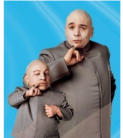
Некоторые фейлы становятся винами .