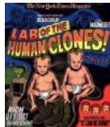
Долли, самый известный клон