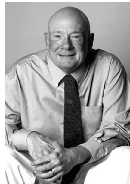
Доктор Смерть Реймонд смотрит на тебя, как бравый солдат Швейк на выпивку.

По мнению экспертов-медиков, переживания после клинической смерти связаны скорее с физическими процессами, проходящими в моске болезного, в нестандартных для него условиях. Большая часть повторяющихся в рассказах коматозников (то есть, скорее всего, не придуманных) эффектов клинической смерти вполне объясняется рядом причин, по отдельности или в комбинации: