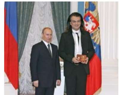
Дарагой Филипп Бедросович вручает награду какому-то маленькому человечку

Судя по последним новостям, show is going on — у Фили появился ещё и сын .