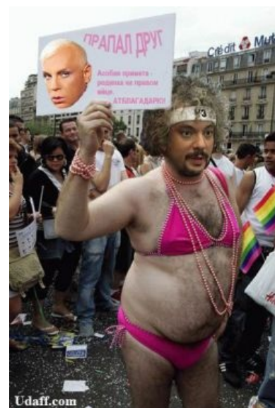
Субъект глазами удава

«Жизнь нужно прожить так, чтобы не превратиться в Киркорова. »