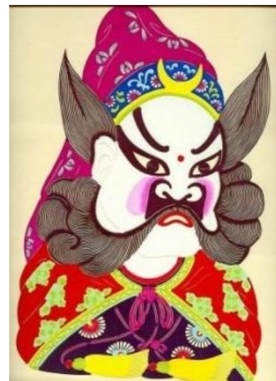
Portrait of Babubei