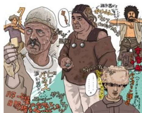
За коробок КЦ можно и на мунспике подумать