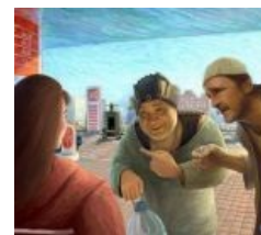
Прямо в картинах