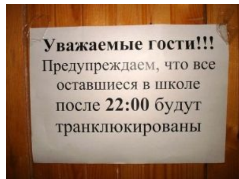
Ку или не ку?