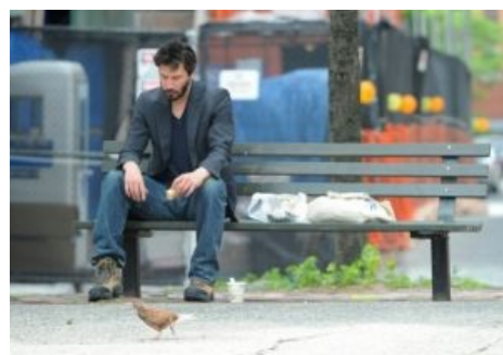
Та самая фотография

И понеслась: кто-то открыл сайт thankyoukeanu.com , где люди