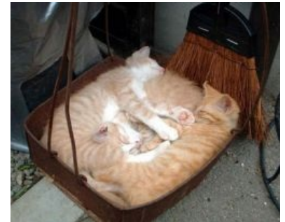
Без котэ статья была бы неполной