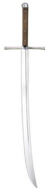
Готичная катана по-немецки