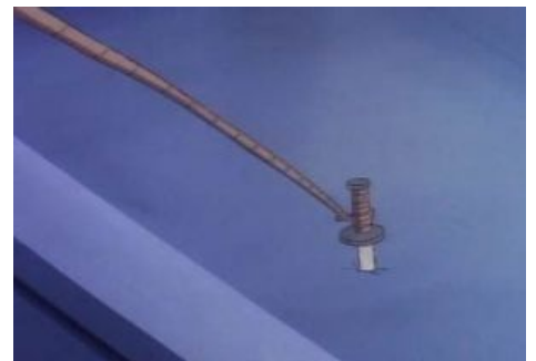
Леонардо знает толк в катанах!

Ковка мечей годами абсурдна также по сугубо практическим соображениям. Вспоминая историю обнаруживаем, что малюсенькая Япония постоянно сотрясалась междуусобными войнами. А в таких условиях ковать годами оружие мягко