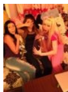
Разрабатывает рот шариком