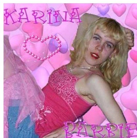
Make me unsee it