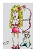
Розовое TV. OMG!