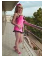
Отрешенная, витаает в розовых мечтах