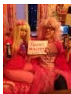
Вместе с Тёркиным