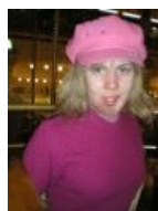
В начале карьеры