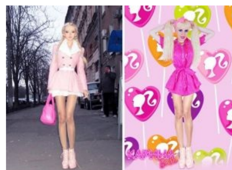
Оригинальное фото и плагиат