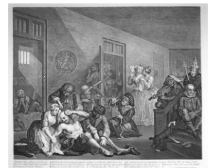
Бедлам глазами художника