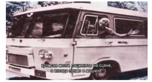
Уолтер Фриман делает вам ручкой.

Доктор Фердун Уолтер Фриман немного творчески доработал этот метод: зачем сверлить, если есть монтировка? Можно просто приподнять веко, загнать под глазное яблоко длинное шило и потыкать им пару раз (без анестезии, заметьте!), достигнув эффекта разрушения мозга, примерно как при лоботомии. Фриман развезжал по штатам на своём пативене и делал свои «целебные» процедуры направо и налево. Со временем, к сожалению, руки доктора стали дрожать, и в один прекрасный день один из пациентов умер прямо на операционном столе, за что докторишке лишили лицензии. Всего он провёл более 3500 операций, причём около четверти из них превращали человека в «овощ». Всего же лоботомию в течении 1940—1960 годов почувствовали на себе около 100000 человек. Как выяснилось в наши дни, Фриман калечил пациентам те участки мозга, которые отвечают за контроль импульсивного поведения. Так что отойдя от ступора после операции пациенты полностью слетали с катушек. Пруфвидео с целевешим пациентом.