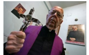
Экзорцист смотрит на тебя как на пациента.

Позже вместо инсулина стали использовать метразол, оказывавший схожее действие. Больные теперь лежали по кроватям связанные и дружно тряслись в конвульсиях. Тогда же был придуман и ещё один метод для уничтожения плохих клеток мозга — электрошок . Изобретателями его оказались два итальянских психиатра, бывавших на скотобойне и заметивших, что перед забоем свиней, чтобы те были спокойнее, к их вискам прикладывают электроды, подсоединённые к обычной розетке. После этого электрошок стали широко