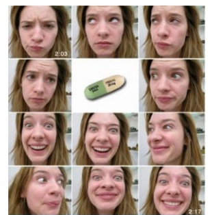
Прозак. Прими пилюльку.