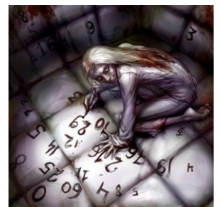
Сферический псих в палате мер-и веев