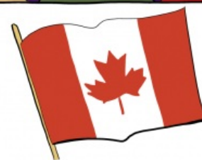
Канадцы такие канадцы.