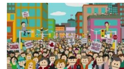
Мнение South Park насчёт Канады