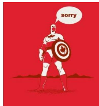
Капитан Канада небезосновательно вежлив

Трамвай в Канаде называют — «street car», а метро — «subway». Вместо расово верных «train» и «metro» « tube » «underground» (кроме Квебека, где tramway и métro таки расово верны).