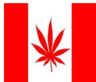
Расово верный флаг

Каждый пятый канадец употребляет, инфл 100% . В том смысле, что он курит траву как минимум раз в неделю, а многие долбят каждый день. В Канаде разрешено употребление травы, так что это рай для укурков. Курят в закоулках, на остановках, в парках, на парковках, дома и вообще почти везде. Следуя из пункта А в пункт Б, почти наверняка унюхаешь траву минимум один раз по дороге. В 2018 году, после долгих лет верчения вилкой в зубах, Трюдёнот так добился легалайза, но в провинции разнарядка пришла по-своему. Например, в Онтарио можно не только курить, но и самому выращивать вплоть до 4-х кустов на жилплощадь. А вот в Квебеке выращивать самому ничего нельзя, всё нужно покупать в спецмагазинах (типа кваки курят больше остальных, поэтому вот). В общем-то говнеца это всё повбрасывало ещё как.