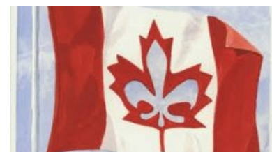
Квебек — заноза в британской заднице

Французская Канада — это как Татарстан в России: вроде бы и Россия, и в то же время какбе не совсем. Проблема отделения Квебека — особый предмет канадской специальной олимпиады. Приезжая туда, например, из Торонто, ты по сути приезжаешь в другую страну. Когда-то там было меньше азиатов (после 2000 года ноу лонгер тру), везде другой язык (хотя инглиш почти везде свободно принимается, пусть и не всегда приветствуется), другая архитектура и т. п. У многих провинций существуют свои программы эмиграции — они проще, чем федеральная, но со своими особенностями. Например, для Квебека нужно знать французский. Чурки его осваивают намного хуже, чем английский, поэтому понаехала меньше. Хотя есть большой потенциал в лице бывших французских колоний (из серии франкоговорящих арабов, коих уже и там дохуя) — но мужики-то не знают, что и спасает Квебек.