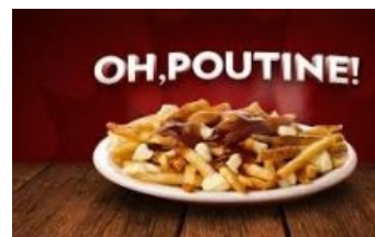
Канадцы едят Путинов на обед