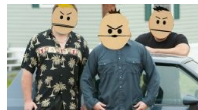
Canadian street gangs

Канада наиболее благоприятна для создания семьи и воспитания детей, то есть для спокойной и размеренной жизни. Другими словами, Канада пиздец как уныла . За исключением крупных городов, людей на улицах нет, пешком ходят только русские и ниггеры. Как и в США, все сдвинуты на моллах (торговых центрах) и чуть ли не живут там, по полдня тусуясь в «Уолмарте». Торговые центры — это новые храмы.