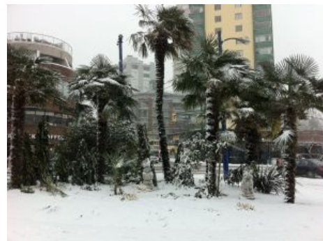
Ванкувер такой Ванкувер.