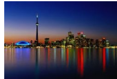
Вид на Торонто с бомбардировщика

Крупнейший город страны, не являющийся столицей. Торонто — неофициальная столица именно англосаксонской Канады. Именно сюда приезжает большинство эмигрантов, именно тут проходит большинство фестивалей. Город очень похож на типичный американский мегаполис типа Бостона или Нью-Йорка, поэтому тут снимают множество голливудских фильмов (например, сериал «Suits»).