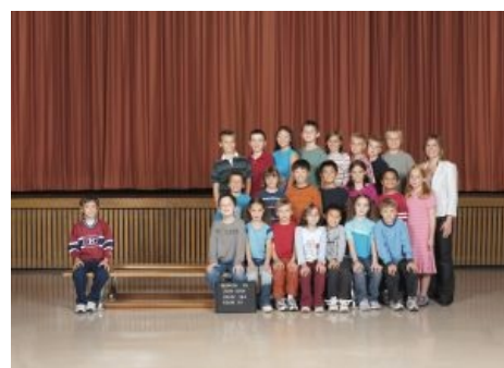
Суть срача от фанатов Торонто