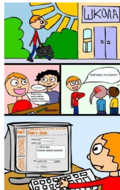
Бойцы за нравственность двава

Вопреки популярному мнению, в вебкаме может работать даже не самая красивая и не самая молодая девушка. Фетишей существует невероятное множество, потому профит могут получать и жирухи, и крокодилы, и старушки, равно как и мальчишки-гомогеи любого совершеннолетнего возраста. К камвхорам