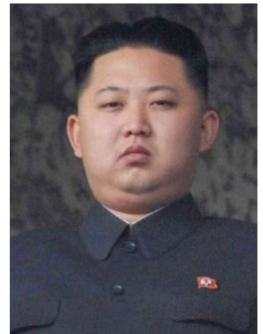
Лидер КНДР смотрит на тебя, как на своего подданного