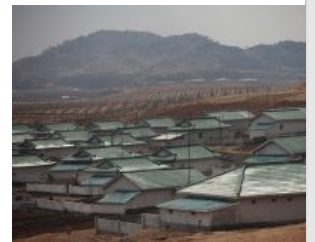
Северокорейская деревня. Травы нет. Съели