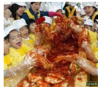
Национальная корейская нямка — кимчхи