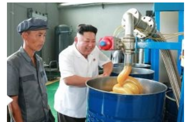
А тут уже повеселее