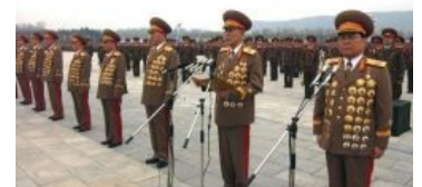
Брежнев соснул с проглотом