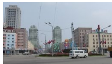
Пхеньян — это как СССР, только КНДР

Ну и, пожалуй, главный вопрос лишь в том, когда таки жажнет. Всё-таки