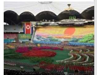
Да, это всё люди

Даже в холодную погоду наш Великий Руководитель, товарищ Ким Чен Ир ездит на машине