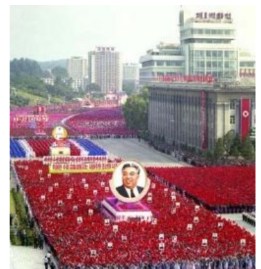
Парад в Пхеньяне: довольные участники построились в ряды и машут флажками