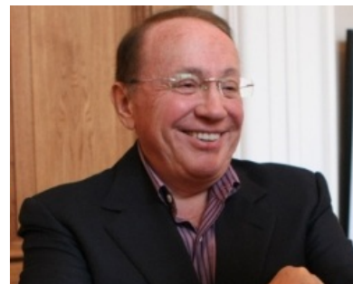
Александр Василич после пластической операции снова смотрит на вас как на говно