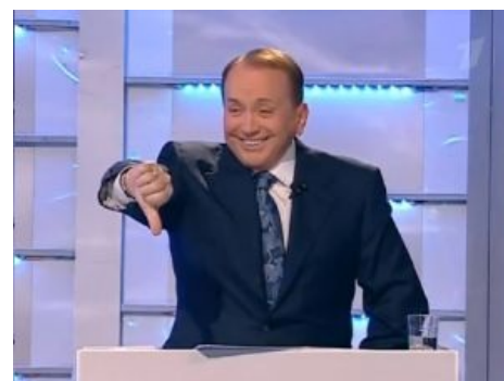
Александр Васильевич не оценил твою шутку