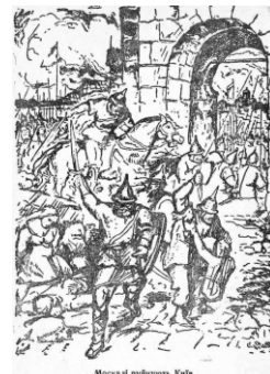
Из школьного учебника Степана Бандеры