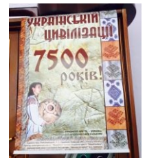
Сходи в музей, узнай, кто основал цивилизацию