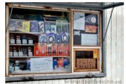
Всё правильно сделал