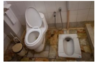
Компромиссный евроазиатский сераль в иранском отеле