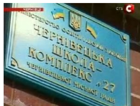
Та самая школа. Этот кадр привёл к деанонимизации