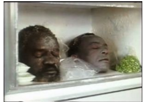
Запас на предмет похавать по ночам