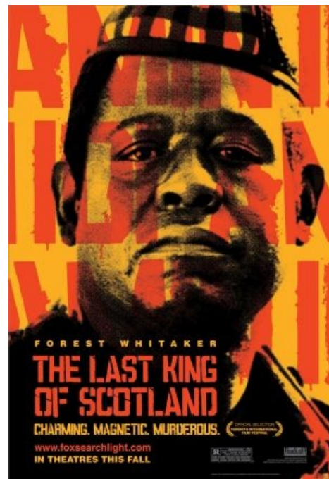
Последний настоящий король Шотландии