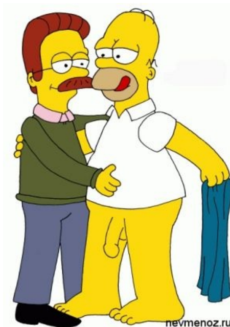
Симпсоны глазами Смыкова

Тут же, естественно, нашлись (и есть до сих пор) сочувствующие и просто моралисты, которые влиянием забугорной кино-, игро- %aunpame% - индустрии, объясняли свою импотенцию в деле воспитания подрастающего поколения. Смыков торжествовал, но суд не спешил выносить приговор. Два с половиной года подряд судьи с большим удовольствием пили пиво и смотрели симпсонов, пытаясь найти там заявленную пропаганду, не нашли, и в 2005 году акkurat