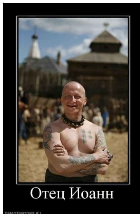
Юродивый батюшка такой юродивый