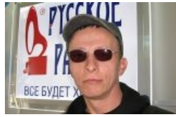
Косплей Пелевина. Фон — no comment