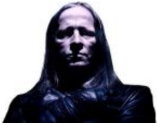
Нет, это не Кипелов