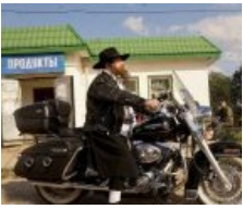
Сферический ЕРЖ в экранизации по Пелевину