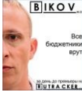
Самый главный врач интерн