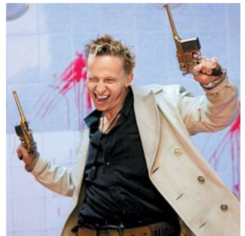
Соловей-Разбойник. Святой человек, БАТЮШКА

На данный момент опустился до таких псевдоблокбастеров Первого Зомбовестьчательного , как «Ирония Любви» и «Дом Солнца» (который, собственно, написал); засветился и в « Generation P », где играл копирайтера-славянофила Малюту — в частности, отжёг в одном из самых мозгоразрывающих роликов.