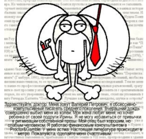
Первый опубликованный в ЖЖ вариант Зайца