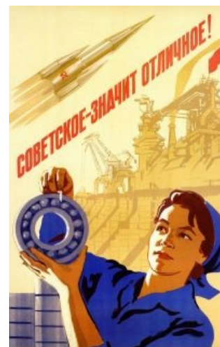
Отличное от других

При Хрущёве советская военщина таки переосмыслила у немцев ракету и притащила её на Кубу , чтобы доказать бывшим союзникам , что на фон Брауне свет клином не сошёлся. Как известно, каждое противодействие рождено действием, и данный инцидент — не исключение. Появлению советских ракет на Кубе предшествовало размещение в 1961 году аналогичных пиндосских аппаратов в Турции, на что, впрочем, всем похуй.