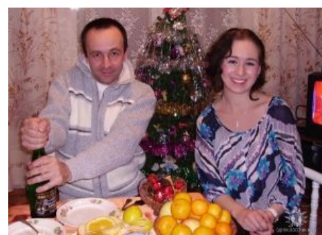
В кругу семьи (с Кевинном Спейси мужем)