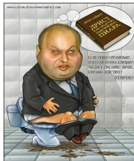
Шарж В. Калининского