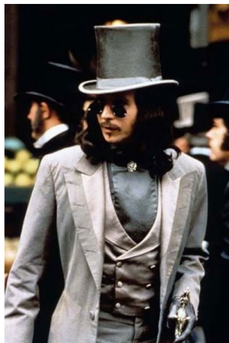
Тенденция к омолаживанию Дракулы

Входит в серию «классических» черно-белых ужастиков тридцатых годов (оттуда же «Мумия», «Франкенштейн», «Человек-волк» который как-бы из сороковых но насрать). В некотором роде именно Бела Лугоши считается эталонным Дракулой, поскольку соответствует классическому описанию: высокий худой человек, брюнет, с длинным острым носом, в черном плаще (возможно, что и с кровавым подбоем ). Правда, от исходного сюжета в фильме мало что осталось и во всём фильме играют ровно два актёра, собственно Лугоши и Двайт Фрай изображающий Рэнфилда, остальные тупо отработывают бабки.