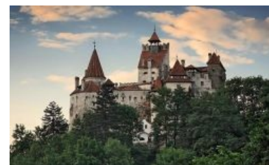
Замок Дракулы в Бране

В 1459 году Дракула перестал платить дань Мехмеду (тому самому, который захватил Константинополь и окончательно выпилил Византию), да ещё и троллил последнего письмами: мол, я, покорный раб султана, не могу отлучиться из страны, чтоб лично привезти ему бабло. Сперва султан купился (или сделал вид), но потом решил покарать обнаглевшего валаха. Мехмед II, кстати, по некоторым версиям был страстный ахтунг , что несомненно прочувствовал на собственной жёне шкуре младший брат Влада — Раду по кличке Кросавчег. Весьма доставляет тот факт, что наигравшись с младшим, султан однажды переключился на старшего, после чего ВНЕЗАПНО потерял мужскую силу. Он, правда, через несколько лет её нашёл, однако за это время отложил тачку-другую кирпичей. Что такого сделал юный Дракула с яйцами султана - неизвестно. Зимой 1461 года султан отрядил некоего Хамза-пашу на встречу с Дракулой, который ВНЕЗАПНО вызвался лично привезти дань (десять тысяч дукатов и 500 мальчиков для апгрейда их до настоящих нидарасов янычар). Почитая себя необычайно хитро выебанным, Мехмед велел Хамзе-паше явиться на встречу с соответствующим эскортом, захватить Дракулу и привезти в Константинополь. Однако Дракула, не будь лох, помнил османское гостеприимство, и тоже прихватил с собой секьюрити, которое оказалось столь многочисленным и решительным, что вырезало турок под корень. Затем brave октябрятя переоделись в басурман и отправились в рейд на юг. Схема была такова: