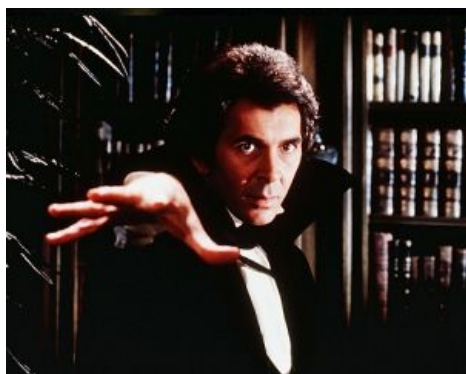
Фрэнк Лангелла в роли Дракулы

Целая серия «Дракул» от студии «Hammer» 60-х и 70-х годов выпуска.