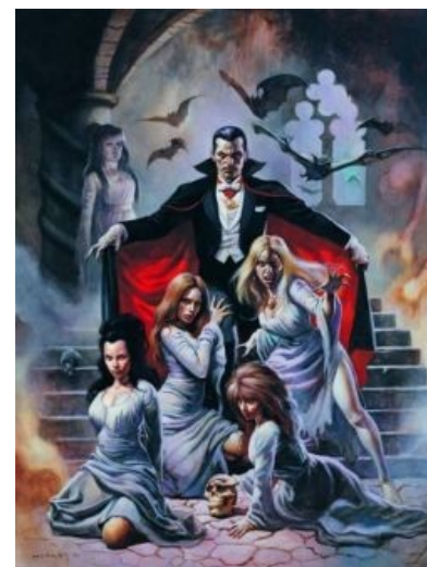
Парадный портрет на фоне развалин сурового готического замка

Потеряв терпение, Дракула наносит решающий удар, и Люси вместе с её матерью — подвернулась под руку — умирают. Все в ахуе. И только Ван Хельсинг знает, что это ещё не конец. Великодушный граф сначала напился крови Люси, а потом заставил её выпить его крови. Поэтому после смерти она тоже стала вампиром. Но ни Артур, ни доктор Сьюард ни о каких вампирах и знать не знают, поэтому Ван Хельсинг устраивает им интерактивную лекцию «Некоторые свойства вампиров на примере Люси Вестенра». И возле гроба торжественно объявляет, что придется воткнуть ей кол в сердце, отрезать голову и набить рот чесноком.