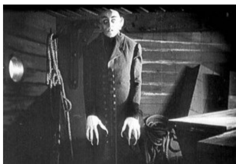
Старое доброе Немецкое кино

«Дочь Дракулы», «Сын Дракулы», «Дракула-2000» — тысячи их! Дракула вообще один из самых популярных киногероев наряду с Шерлоком Холмсом и тремя мушкетерами .