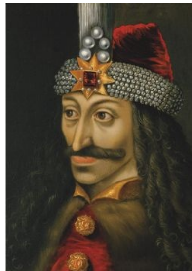
Красавец-мужчина (спойлер: Weegee детектед.)

Первый раз, в 1448 году, Дракула занял трон Валахии как марионетка султана и был быстро выкинут на мороз при попытке доказать, чьи в лесу шишки. Далее вёл нестабильную жизнь типичного князя-нищобрда. Сбежал в Молдавию , но его в 1451 и оттуда попёрли, и оказался он в