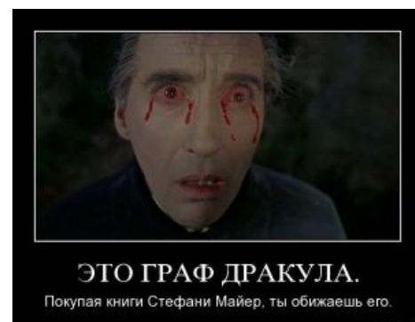
Книги Стефани Майер огорчают Дракулу