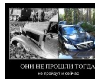
Со времен ВОВ российские дороги прекрасно сохранились