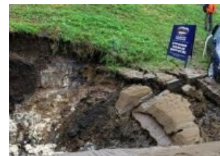
Дороги как распилоёмкий бизнес