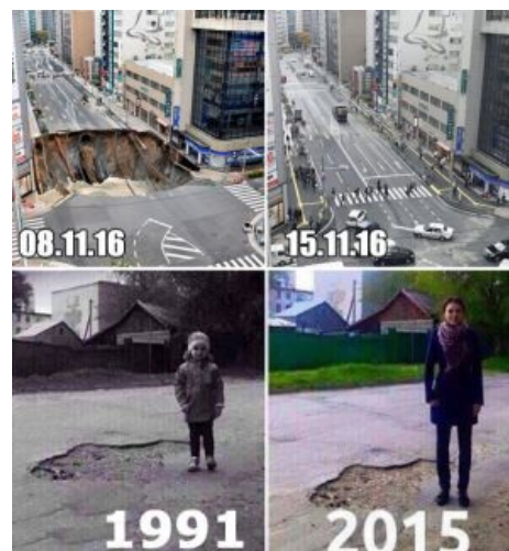
В связи с недавними событиями

Эпичный срыв покровов с темы распила дороги вдоль