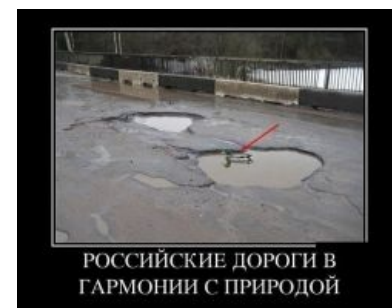
Дорожный пловун, бип-бип!

Дороги России ( бездорожье России ) — сочетание случайных выбоин, впадин, рытвин, открытых люков и отсутствия/кривого присутствия разметки. На большей части территории прокляты сделанными на случай войны противотанковыми рвами, но те по какому-то недоразумению тоже причисляются к сабжу.