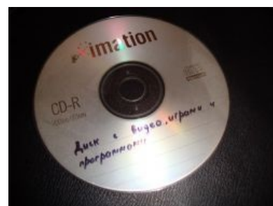
Вот он — Диск Грааля

Вот оттуда и растут ноги сабжевых дисков с приколами. Смешные картинки и видосики были зверем труднодобываемым, порою приходили они от друзей аж на дискетах и складировались в специально