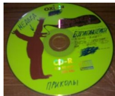
Диск Медведа — более современный вариант