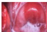
Дисбактериоз влагалища (Бактериальный вагиноз).