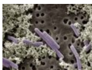
Лакто-бактерии. Видимо фиолетовые.