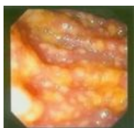
Кишечник, пораженный сабжем у ребенка.