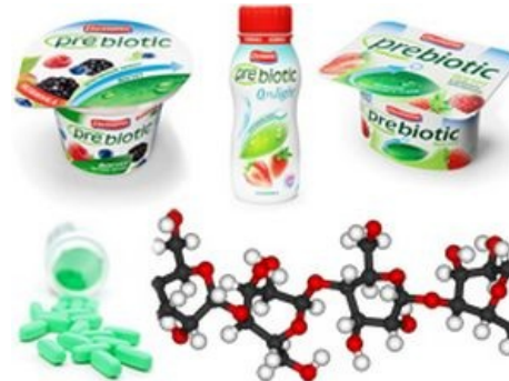
Шаблонная реклама Био-добавок.

Текут сопли? На лице прыщи? Не получается «запастись иммунитетом»? Дак это же дисбактериоз, не иначе! Покупайте наши БАДы всего за 799.80, ведь весь ваш иммунитет, смысл жизни и, главное, мозги расположены именно в вашем брюхе, посреди полудоделанного говна! Не доверяете БАДам? Купите наш биоюгурт с высокоиммунным названием, он содержит бактерии ЧудоПомогайкис, запатентованные фирмой-производителем бактерий(!), которые мгновенно всё поправят! Стало в последние дни херовато от питания одним капустным листиком в день ? Это просто дисбактериоз! Пейте нашу чудесную разболтанную в воде известку, она не содержит ни одной калории, зато столько бактерий %название_фирмы% исцелямбус!