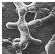
Та самая бифидо-бактерия.